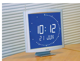
Opalys Ellipse montaje encastrado