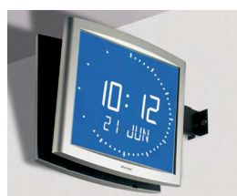
Opalys Ellipse en brazo para doble cara